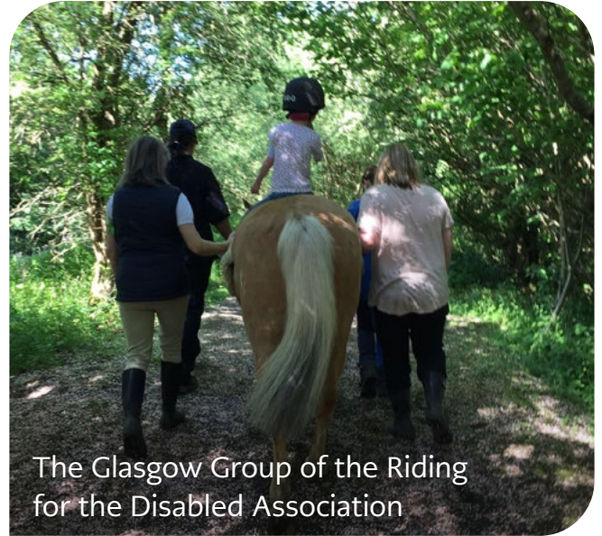
The Glasgow Group of the Riding for the Disabled Association

Mae therapi ceffylau yn gyfle i ymarfer a datblygu sgiliau cymdeithasol, ond gall agor drysau i lawer mwy. Mae teuluoedd yn aml yn “chwilio am weithgaredd lle gall eu plentyn gymryd rhan, ond cymryd rhan lawn, hyd yn oed ag anabledau. A gan mai gweithio gyda cheffylau ydyw, gallwn, gallwn ni wneud hynny. Y plant sy'n defnyddio cadeiriau olwyn neu gerddwyr, pan maen nhw'n hacio [marchogaeth] allan ar y llwybr natur sydd gennym ni wrth ymyl yr afon yma, maen nhw'n uchel uwchben pawb arall, yn gallu profi'r math hwnnw o ryddid ym myd natur.” Gallant addasu gemau'r iard – bingo, neu “Faint o'r gloch yw hi, Mr Blaidd?” – ar gefn ceffyl.