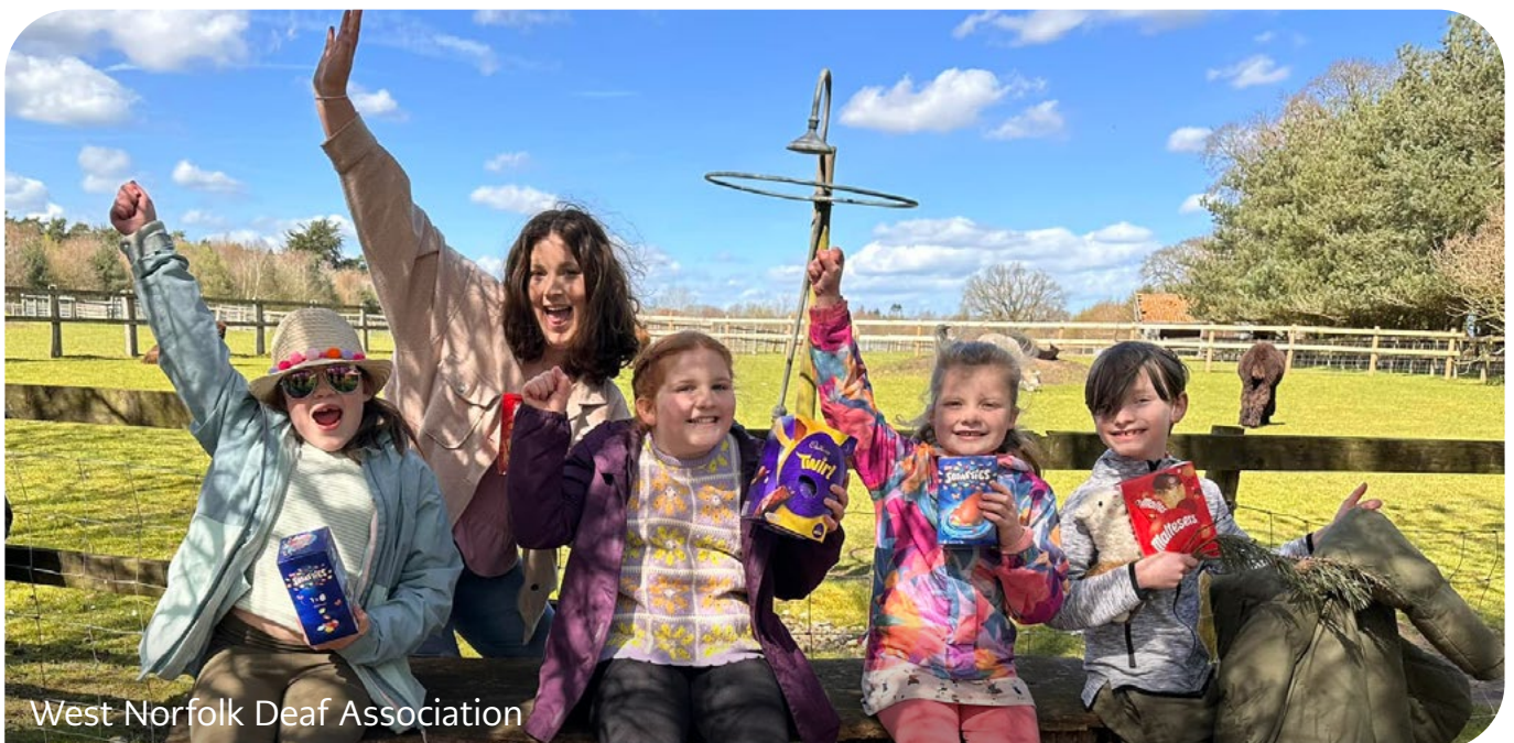
West Norfolk Deaf Association