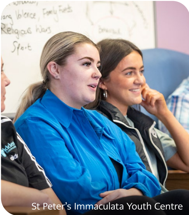
St Peter's Immaculata Youth Centre

ynddynt. Rydym yn credu mai cyfathrebu yw sail pob ymddygiad. A bod gan bob person ifanc hawl i gael mynediad at wasanaethau.”