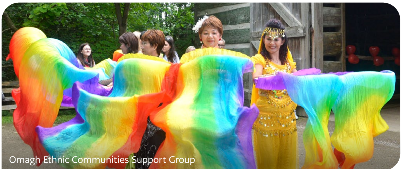
Omagh Ethnic Communities Support Group

Mae’r grŵp yn cynnig cyrsiau rheolaidd am ddim yn Saesneg i siaradwyr ieithoedd eraill (ESOL), ynghyd â chyrsiau lles fel Pilates ac ioga, a sgiliau ymarferol fel diogelwch bwyd.